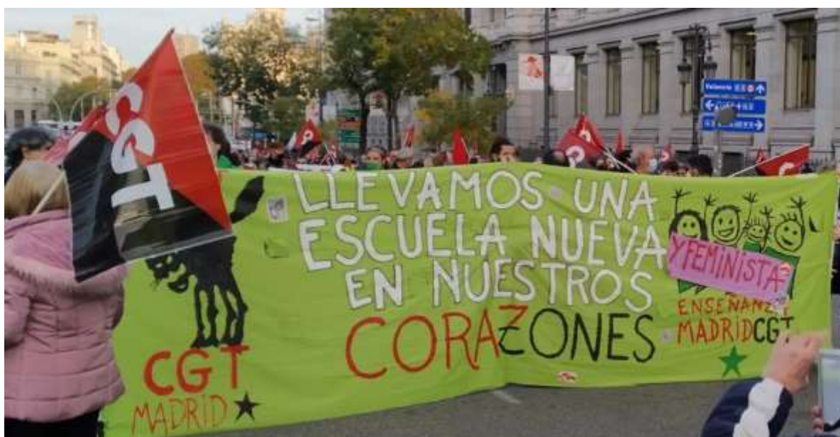
Imagen de portada y esta de la Huelga General del 11 de Noviembre de 2020

Solo desde la unidad y el apoyo mutuo pueden conseguirse unos logros beneficiosos para todos y para todas.